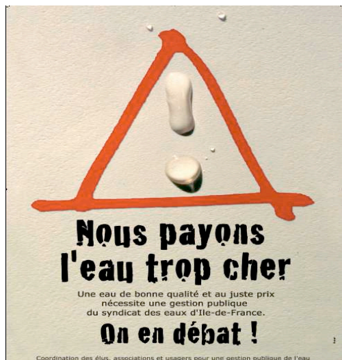
L'affiche du collectif « Eau Île de France »

- Premièrement, au niveau de l'exploitation du réseau de distribution, où le budget du syndicat sur ce poste surpasse de façon bien trop importante les coûts de la réparation des fuites qui constitue le cœur de cette